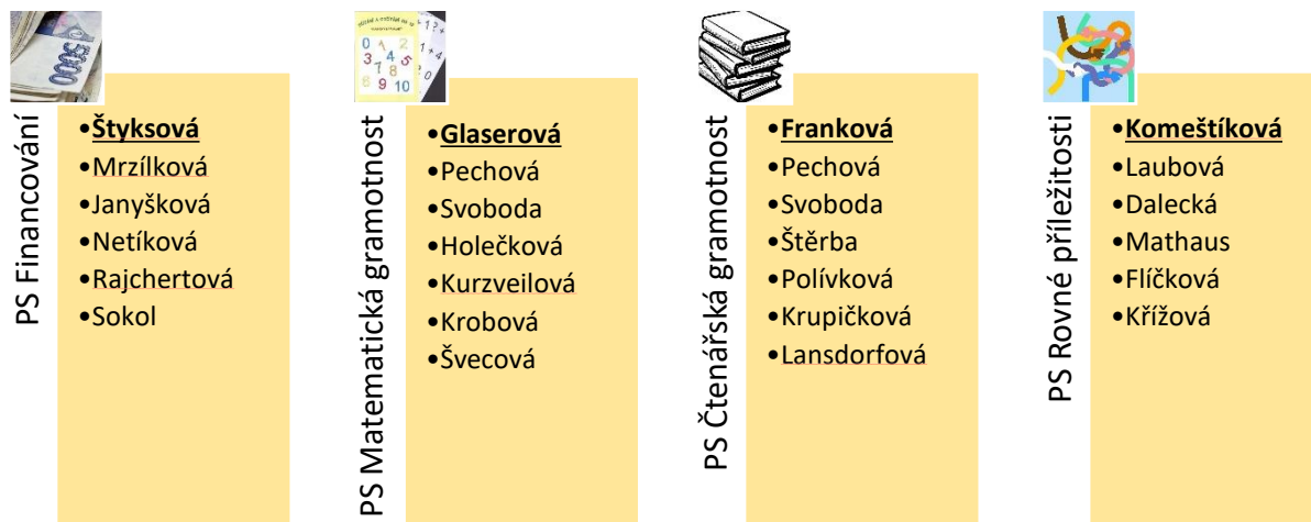
Tabulka 4 - Složení Pracovních skupin MAP III v ORP Neratovice