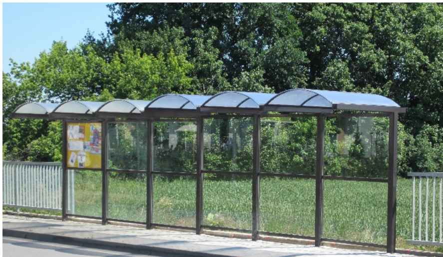
Podobně bude ještě letos vypadat 34 zastávek v 11 obcích regionu MAS Nad Prahou