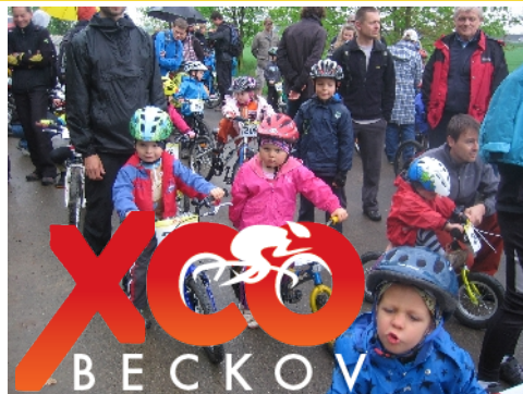
Kategorie nejmenších cyklistů na startu loňského závodu

Závod byl součástí seriálu SPINFIT Dětského MTB Poháru a UAC MTB pro dospělé a dle vyjádření P. Mišoně projevíly agentury pořádající tyto seriály i letos zájem o zařazení závodu XCO Beckov do jejich programu. „Chtěl bych pozvat příznivce cyklistiky na start závodu letošního ročníku, který se uskuteční v sobotu 3. května“ dodává P. Mišoň. Letošní ročník se pojedí